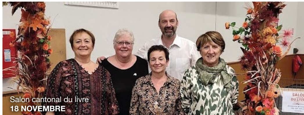
Salon cantonal du livre 18 NOVEMBRE