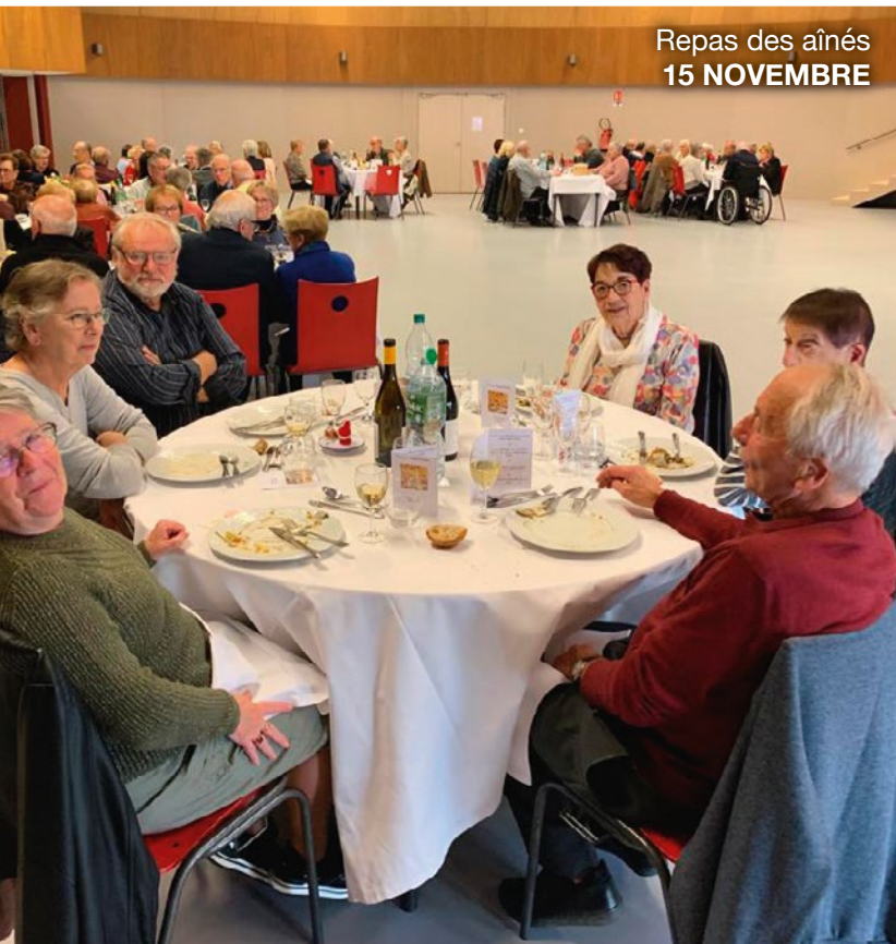
Repas des aînés 15 NOVEMBRE