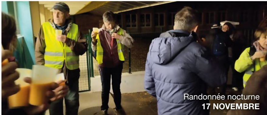
Randonnée nocturne 17 NOVEMBRE