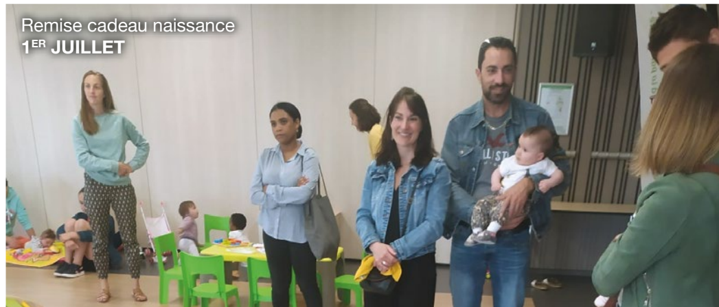
Remise cadeau naissance 1 ER JUILLET