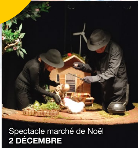
Spectacle marché de Noël 2 DÉCEMBRE