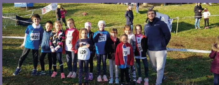
Les Eveils au 2 ème Cross du Challenge à CEYRAT