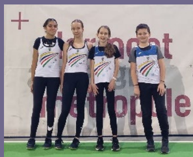
Les Benjamins et Minimes lors du 1 er Tétra et Pentathlon de la saison au Stadium JEAN PELLEZ

Pour la suite du Challenge Cross, tous les athlètes se rendront à Issoire, puis à Chanat-la-Mouteyre (Chamalières), Riom, Pérignat-lès-Sarlève, Saint-Georges-de-Mons, et enfin Thiers pour terminer cette Challenge 63 de 8 Cross.