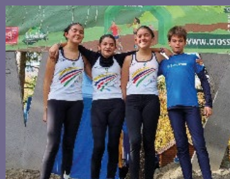
Les Benjamins et Minimes au Cross de VOLVIC