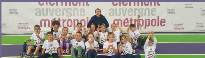
Les Eveils et Poussins lors de la 1 ère Animation de la saison au Stadium JEAN PELLEZ