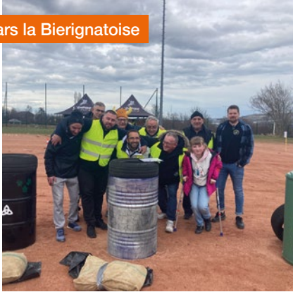
Mars la Bierignatoise