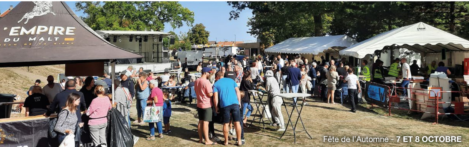
Fête de l'Automne - 7 ET 8 OCTOBRE