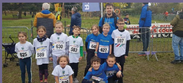
Les Eveils et les Poussins au 1 er Cross du Challenge à BEAUMONT