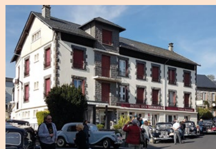
La sortie Gourmande a fait étape cette année à l'hôtel des voyageurs à Ally (43)

Contact : Bruno Murat, 6 bis rue Marcel Magard, 63170 Pérignat-lès-Sarliève / 06 15 25 63 72