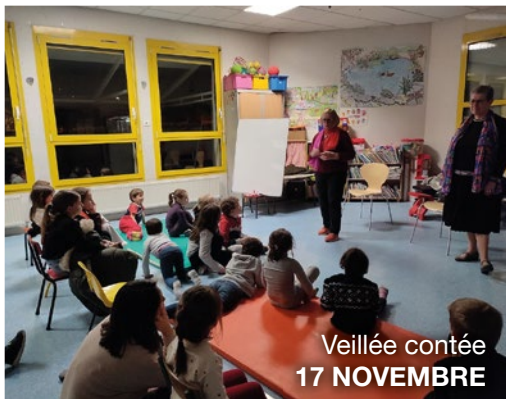
Veillée contée 17 NOVEMBRE