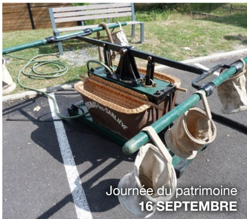
Journée du patrimoine 16 SEPTEMBRE