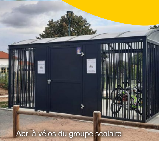
Abri à vélos du groupe scolaire