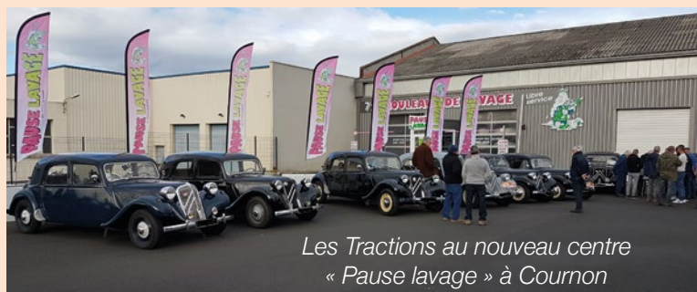
Les Tractions au nouveau centre « Pause lavage » à Cournon