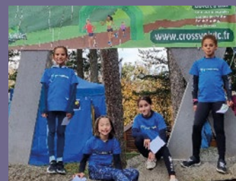
Eveils et Poussins au Cross de VOLVIC