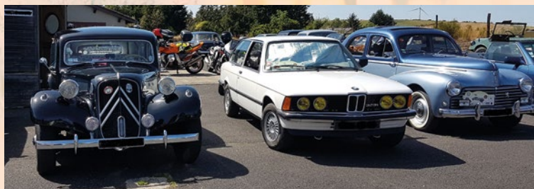
La Route du pain est une sortie organisée par le TCV mais qui accueille toutes sortes de voitures anciennes

Les belles journées d'automne ont été propices pour faire rouler nos Tractions. De belles autos dans de beaux paysages ravissent à la fois les conducteurs et ceux en bord de route qui profitent du spectacle.