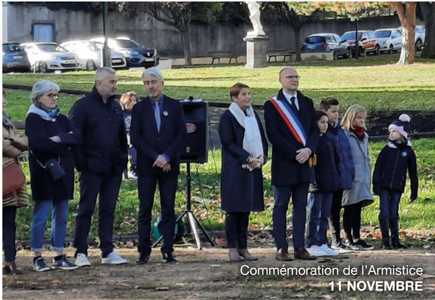
Commémoration de l'Armistice 11 NOVEMBRE