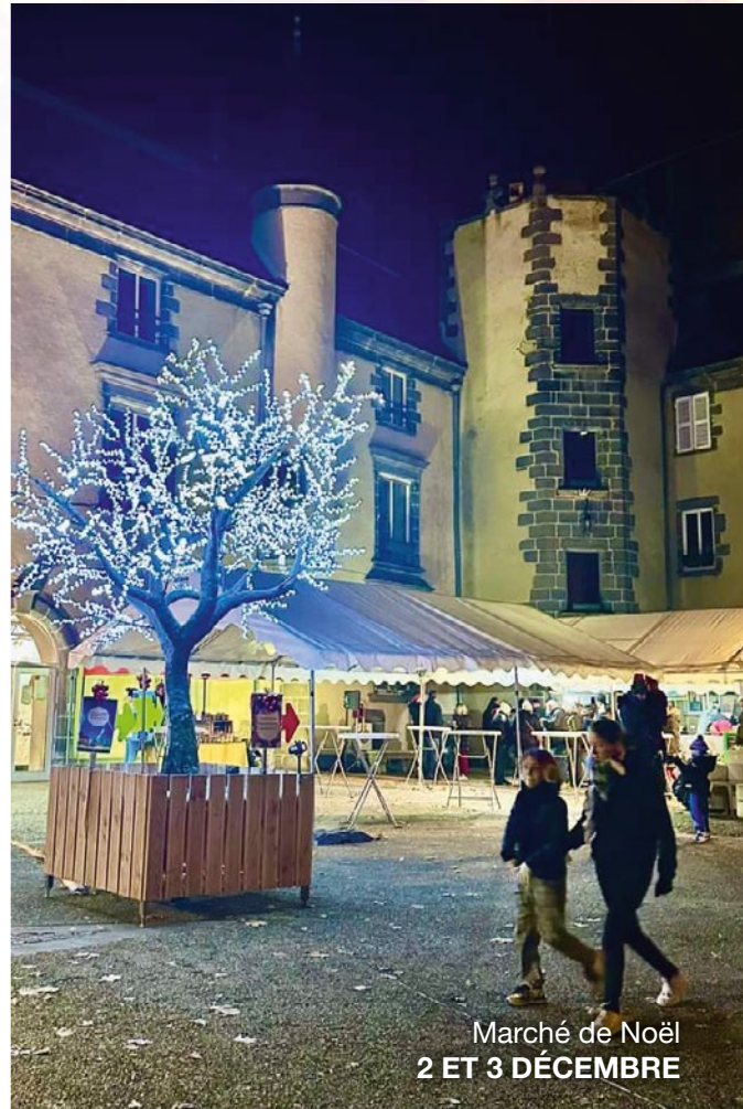
Marché de Noël 2 ET 3 DÉCEMBRE